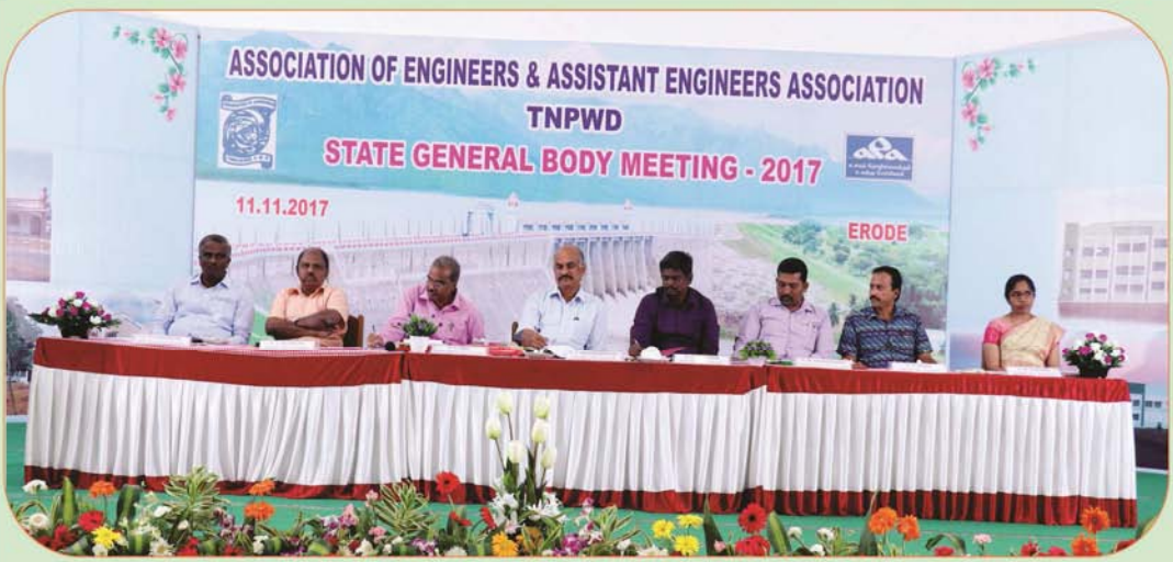
Annual General body Meeting AOE & AEA at Erode

PORIYALAR, Egmore RMS / 1 Patrika, Chennai Reg. No.T.N. / CH (C) / 307 / 15 - 17 Posted on : 22.11.2017, Licensed to Post without prepayment under WPP No.TN/PMG(CCR), WPP No.340/15-17