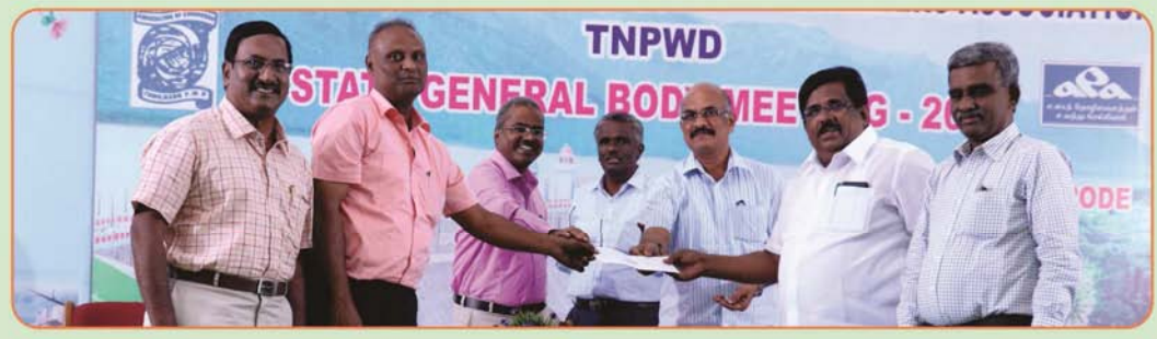
Rs.1 Lakh Building fund to Coimbatore Branch