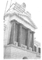
₹10 ஆயிரம் முதல் ₹17 ஆயிரம் வரை மாத ஊதியத்தில் இழக்கின்ற நிலை ஏற்பட்டுள்ளது. ஆனால், இதற்காக வெளியிடப்பட்டுள்ள அரசாணைகளில் ஊதியக் குறைப்பிற்கு குறிப்பிடப்பட்டுள்ள

இணையான ஊதியம் என்று சொல்லிக் கொண்டே பொறியாளர்களுக்கு ஊதியத்தை தமிழக அரசு குறைத்துள்ளது. மத்திய அரசில், உதவிப் பொறியாளர் பிடி படித்து பெற்றவர்.